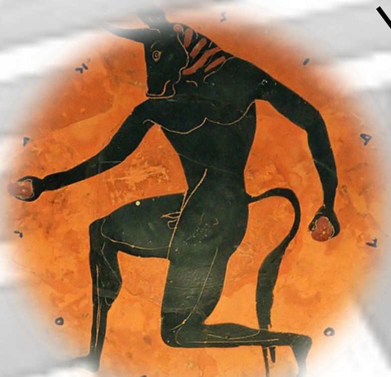
Kylix, ca. 515 a.C., Museo Arqueológico Nacional de España