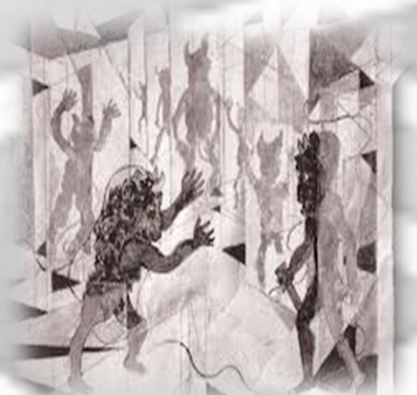
Friedrich Dürrenmatt, La ballata del Minotauro