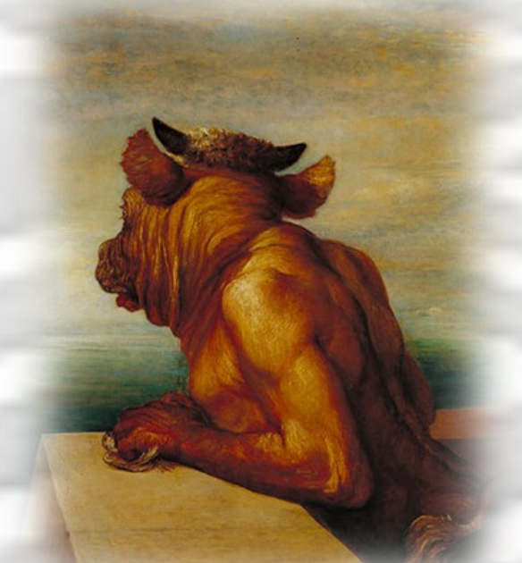
George Frederic Watts, Il minotauro , 1885