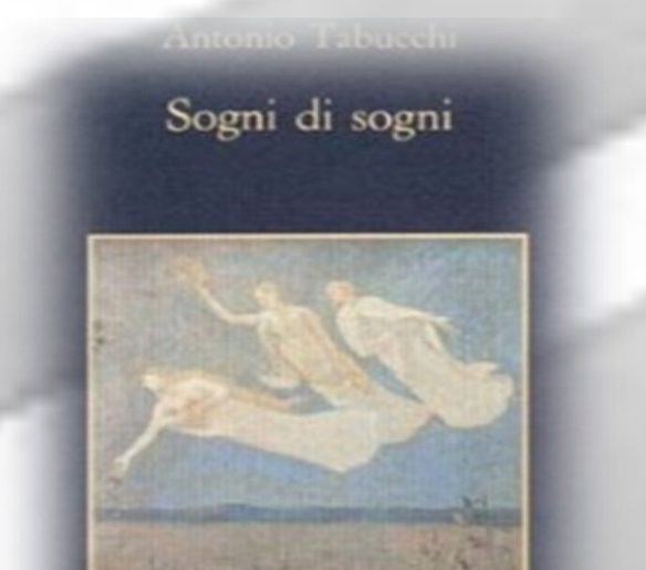
Sellerio editore Palermo