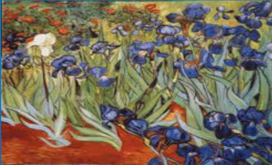
Van Gogh, Iris , 1889, P. Getty Museum, Los Angeles